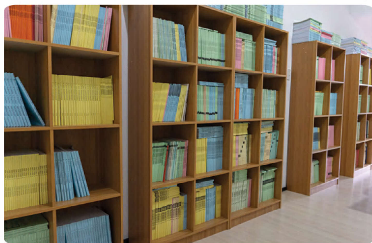
LEARNING RESOURCE AREA