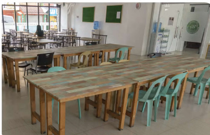
CAFETERIA & STUDY SPACES